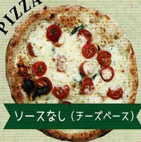
ソースなし (チーズベース)