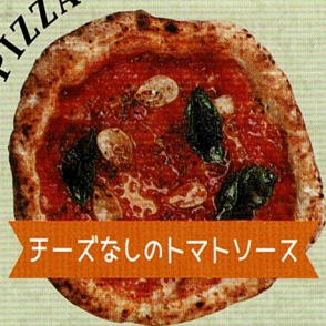
チーズなしのトマトソース